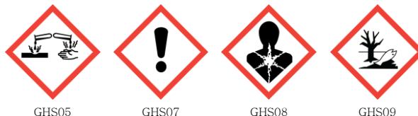
GHS05 GHS07 GHS08 GHS09